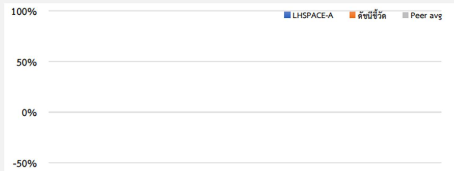
ผลการดำเนินงานย้อนหลังแบบปักหมุด ( 1 %ต่อปี)