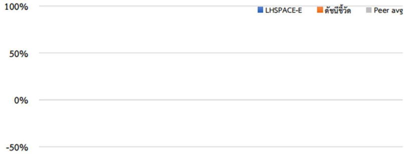
ผลการดำเนินงานย้อนหลังแบบปีกลุ่ม (%)ต่อปี